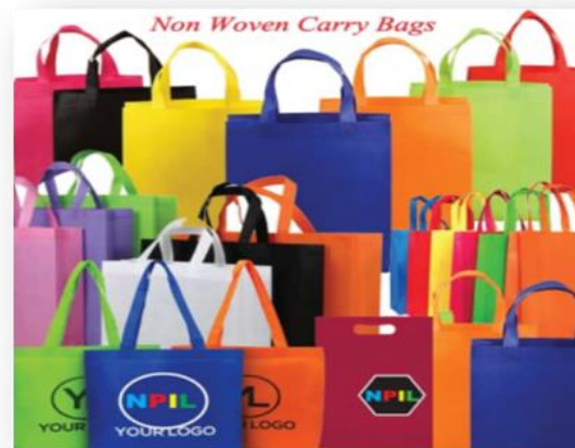
Vielfalt ist unser Anspruch !