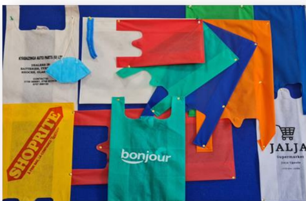
Sortiment unserer Taschen

Rohmaterial für unsere Non Woven Taschen