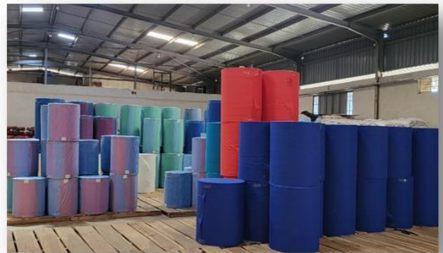
Unsere Non-Woven-Rollen – Produktionsanlage - fertige Rollen für die Produktion