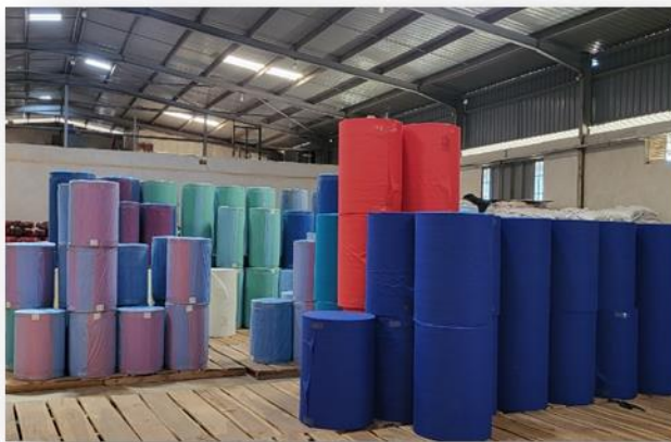
Fertige Non Woven Rollen