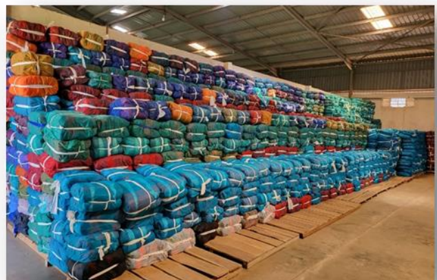
Fertige Taschen verpackt nach Größen