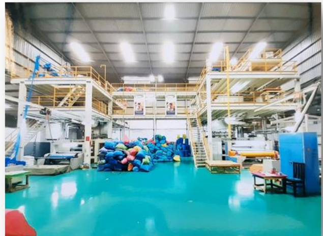
Unsere Non Woven Rollen - Produktionsanlage