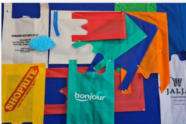
Sortiment unserer Taschen