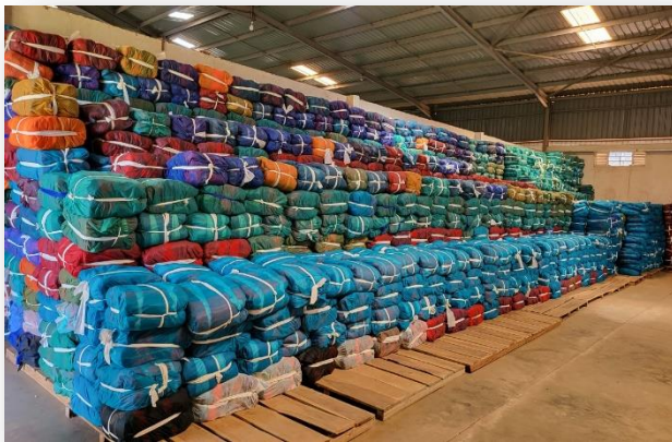
Fertige Taschen verpackt nach Größen