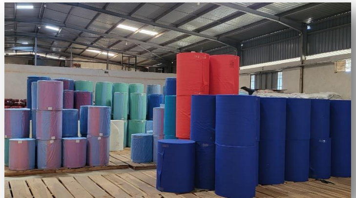
Fertige Non Woven Rollen