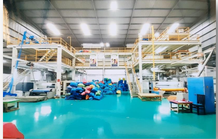
Unsere Non Woven Rollen - Produktionsanlage - Kapazität pro Tag: 8 tonnen